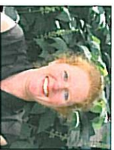
Oost Tukkje Tuk Liebergen en Astronomische buurt ttuk@versawelzijn.nl